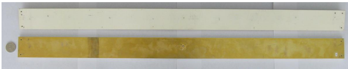
Рис. 1. Фотография печатной антенной решетки.