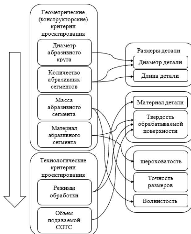
Рисунок 2 – Алгоритм проектирования сборного шлифовального круга с радиально подвижными абразивными сегментами

силы резания во время шлифования к рабочей части абразивного инструмента крепится дополнительный груз б.